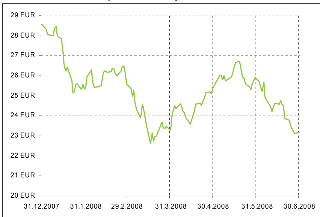
Gibanje VEP Krekovega sklada MOST

Donosnost Krekovega sklada MOST na dan 30.06.2008: