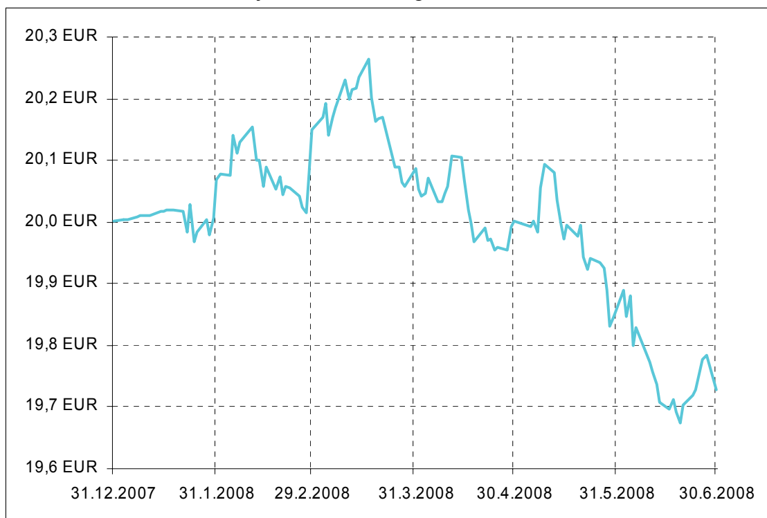
Gibanje VEP Krekovega sklada SIDRO

Donosnost Krekovega sklada SIDRO na dan 30.06.2008: