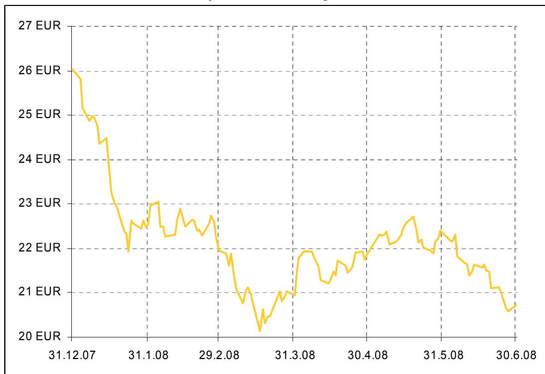
Gibanje VEP Krekovega sklada KLAS

Donosnost Krekovega sklada KLAS na dan 30.06.2008: