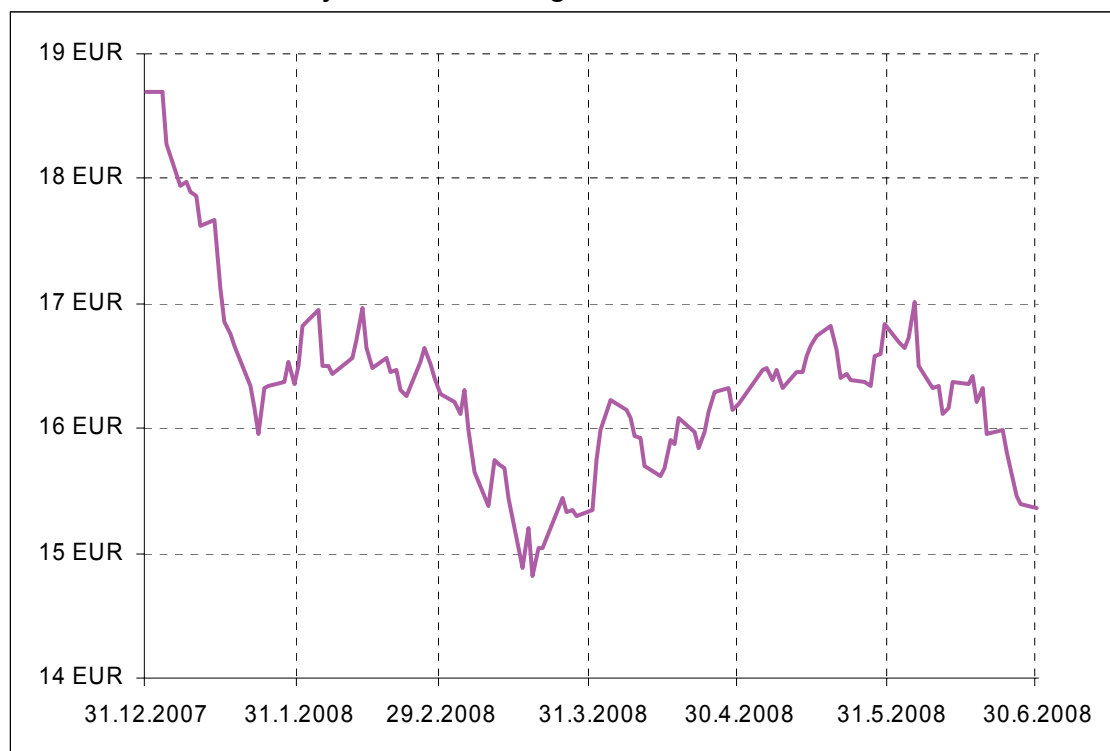
Gibanje VEP Krekovega sklada NANO&TECH

Donosnost Krekovega sklada NANO&TECH na dan 30.06.2008: