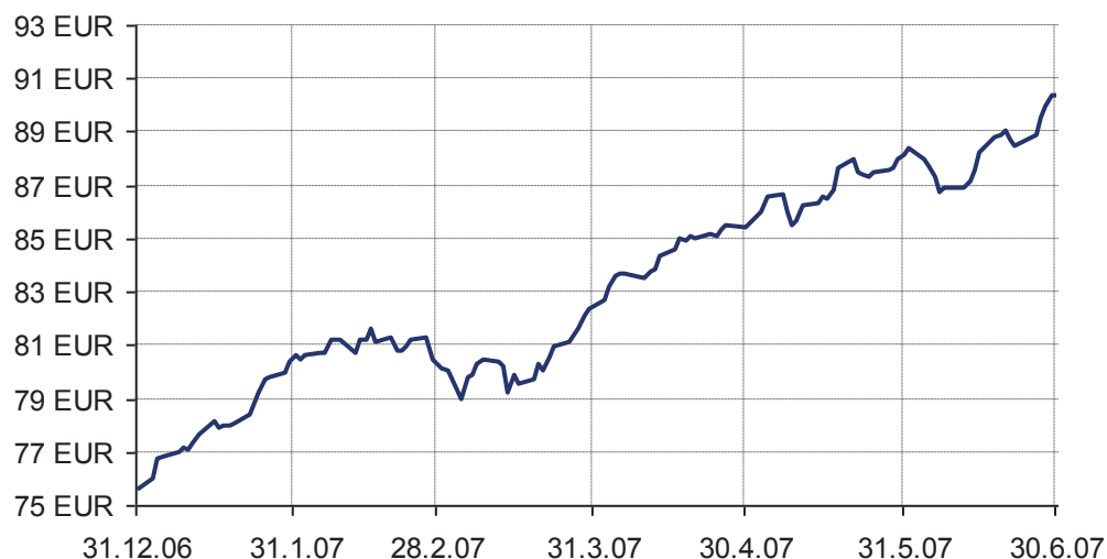
Gibanje VEP Krekovega sklada SKALA

Donosnost Krekovega sklada SKALA na dan 30.06.2007: